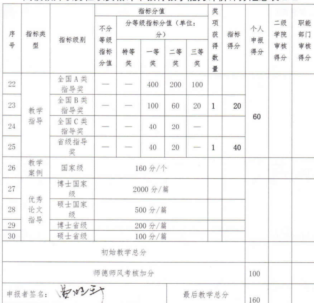
高校教师职务任职资格评审教育教学能力评价计分汇总表 2-2

注: 1. 为鼓励协同创新、团队创新, 凡是我校多名教师合作的教学成果、一流课程、教材、教学作品和教学案例奖励, 两名教师合作的奖励分别按相应分值的 70%、30% 计算, 三名教师合作的奖励分别按相应分值的 65%、25%、10% 计算, 四名教师合作的奖励分别按相应分值的 65%、20%、10%、5% 计算, 五名及以上教师合作的奖励, 前四名分别按相应分值的 60%、20%、10%、5% 计算, 其余名次按相应分值的 5% 平均计算。