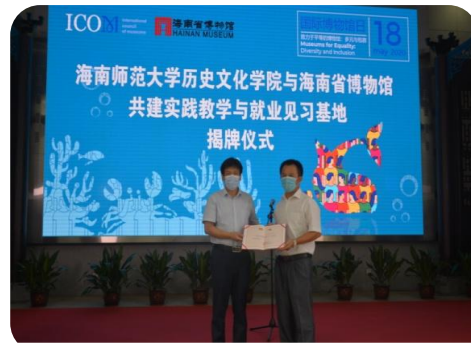
历史文化学院与海南省博物馆共建实践教学与就业见习基地