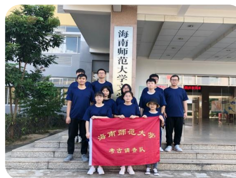
历史学专业组建考古队进行专业知识考察