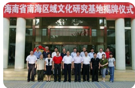
南海区域文化研究基地 揭牌仪式